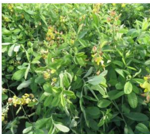
Figura 4: Crotalaria brevipflora - Sementes Piráí, 2022.

A espécie C. brevipflora , por sua vez, tem porte mais baixo e ciclo curto, sendo recomendada para sistemas que necessitam de cobertura rápida, controle de nematoides e baixo risco de comportamento trepador (Figura 4). Com estrutura arbustiva, distingue-se pelo crescimento rápido e ciclo de florescimento ocorre de 90 a 100 dias após o plantio (Carvalho et al., 2022).