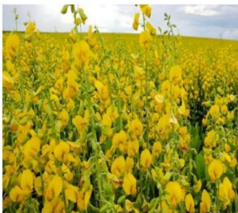
Figura 1: Crotalaria ochroleuca - Santos, 2022.

A Crotalaria ochroleuca é uma planta anual de crescimento ereto, com boa adaptação ao Cerrado, destacando-se por sua rusticidade, elevada produção de biomassa e capacidade de romper camadas compactadas do solo (Figura 1). Estudos apontam sua eficácia na redução de populações de nematoides, promovendo maior produtividade de culturas subsequentes como a soja (Leandro; Asmus, 2015).