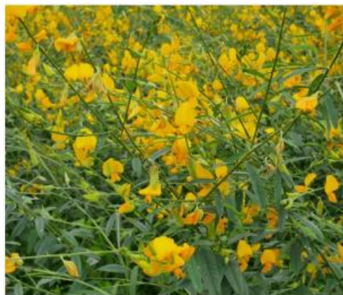
Figura 2: Crotalaria juncea - Esalq, 2022.

A C. juncea é amplamente utilizada devido ao crescimento rápido, elevada produção de matéria seca e bom desempenho no controle de plantas daninhas (Figura 2). Por possuir ciclo curto e elevado teor de nitrogênio acumulado, é ideal para consórcio com culturas perenes (Carvalho et al., 2014; Ambrosano et al., 2014).