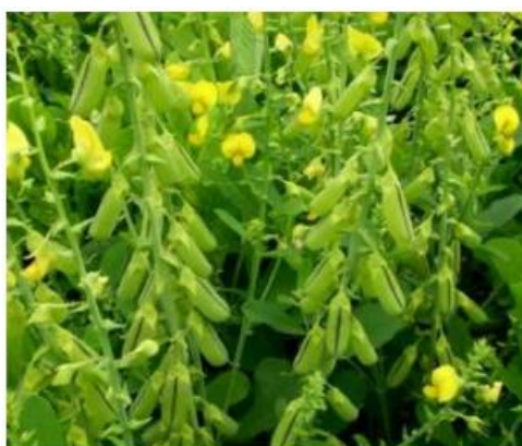
Figura 3: Crotalaria spectabilis - Santos, 2022.

Já a C. spectabilis possui maior ciclo e crescimento inicial lento, porém apresenta produção significativa de biomassa e rápida decomposição dos resíduos, favorecendo a ciclagem de nutrientes (Figura 3). Trata-se de uma planta subarborescente alta, com ramificações, folhas simples, flores completas, e raiz pivotante que se adapta bem a diversos tipos de solo. A produção de matéria seca oscila entre 10 e 20 t ha -1 em ambientes tropicais e subtropicais (Silva et al., 2017).